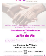
TABLE RONDE SUR LA FIN DE VIE

L'Association Familiale Catholique de Neuilly organise, avec la participation de praticiens, experts et pouvoirs publics, une conférence - table ronde sur la fin de vie le Mardi 1er avril à 20h au Cinéma le Village.