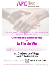
TABLE RONDE SUR LA FIN DE VIE

L'Association Familiale Catholique de Neuilly organise, avec la participation de praticiens, experts et pouvoirs publics, une conférence - table ronde sur la fin de vie le Mardi 1er avril à 20h au Cinéma le Village.